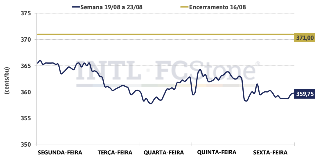
Gráfico1: Intraday semanal - setembro/19 (CME)

Nos siga no Twitter e acompanhe informações do mercado de grãos e commodities agrícolas!